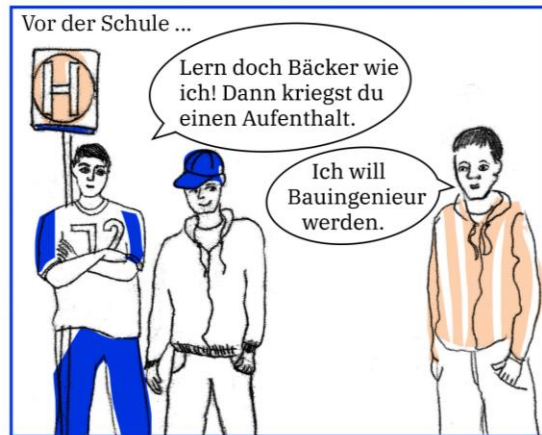
Abbildung 1: Comic zu stereotypen Vorstellungen über geflüchtete Jugendliche